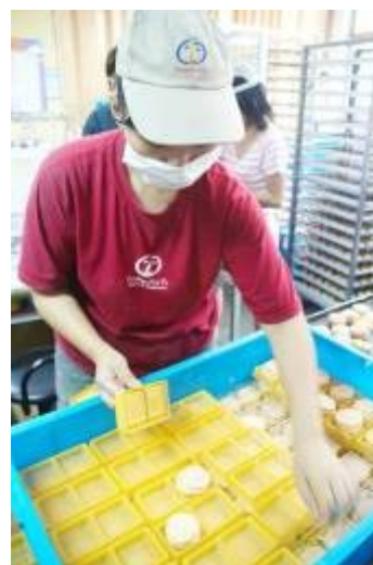
認真工作的憨兒們